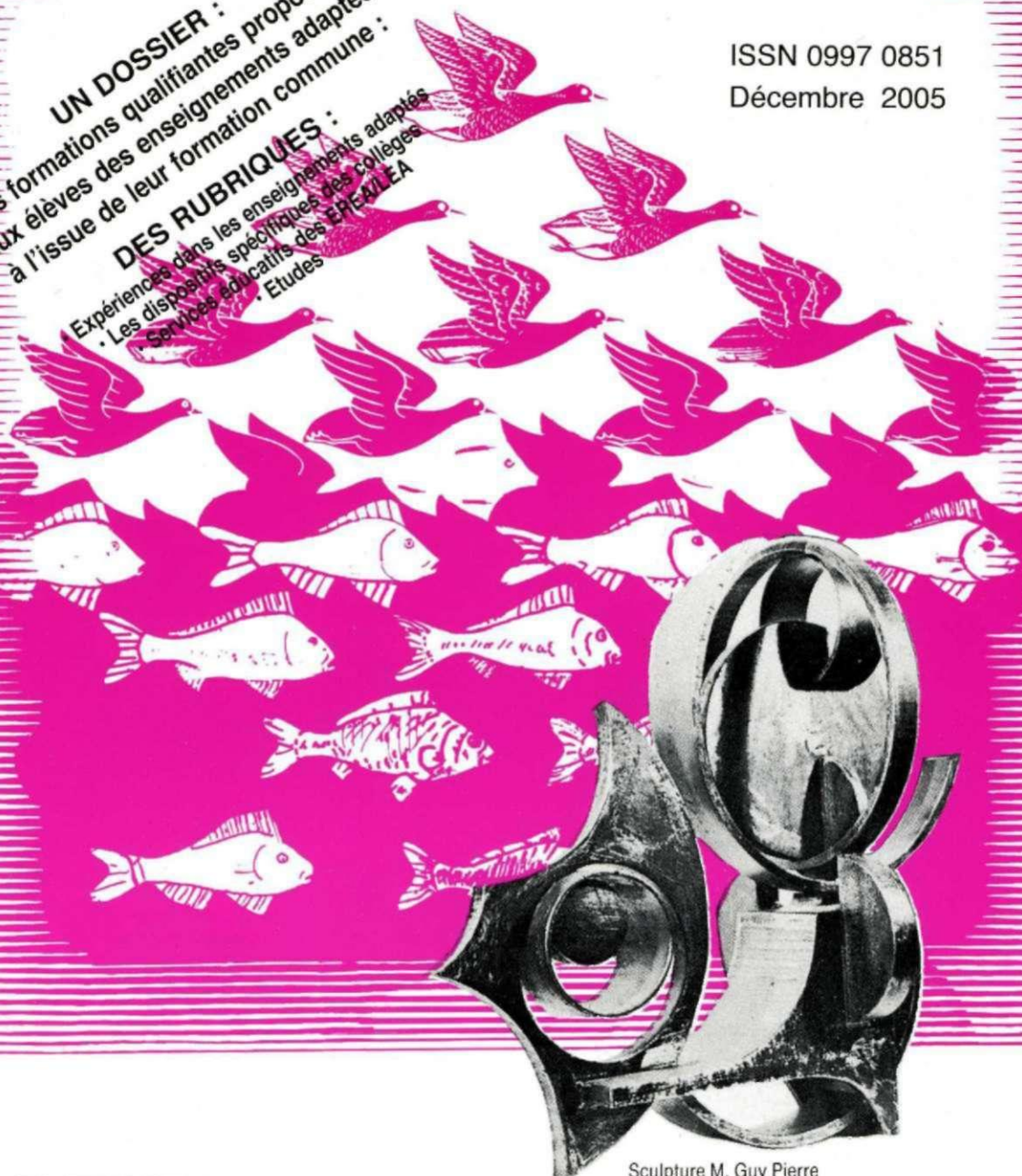
Sculpture M. Guy Pierre

DES RUBRIQUES : Expériences dans les enseignements adaptés • Les dispositifs spécifiques des collèges • Services éducatifs des EPEA/LEA • Etudes